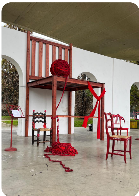
In alto: la grande sedia rossa realizzata dalla Cooperativa Il Germoglio. Sotto: alcuni momenti dell'evento organizzato al Parco Trabattoni in occasione della Giornata Internazionale per l'eliminazione della violenza contro le donne